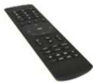
Dálkové ovládání 2x AAA baterie