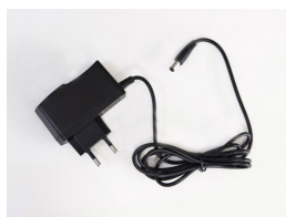
Zdroj, kabel pro připojení do napájecí sítě (230V)