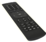
Dálkové ovládání 2x AAA baterie