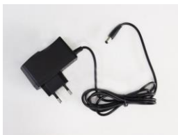
Zdroj, kabel pro připojení do napájecí sítě (230V)